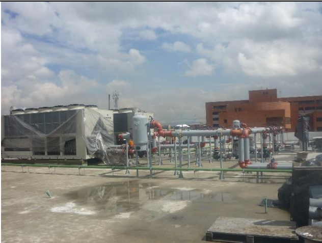
Techo del edificio con algunas afectaciones de aguas lluvias retenidas.