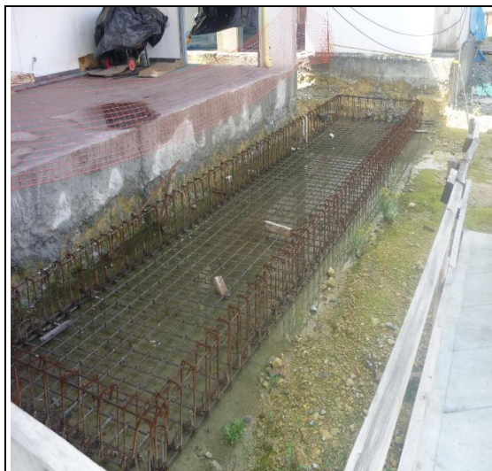
Armado canasta expuesta a la intemperie, sin ninguna protección con afectación por óxido.