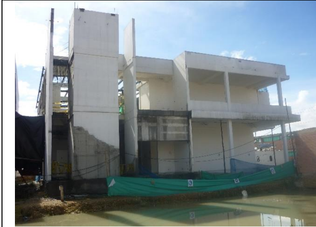
Vista frontal del edificio con afectación de apozamiento de aguas lluvias al frente de este.