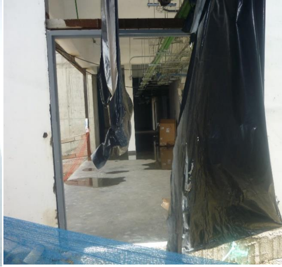
Zona del primer piso afectada por aguas lluvias, al frente de las escaleras y sόcalo del ascensor.