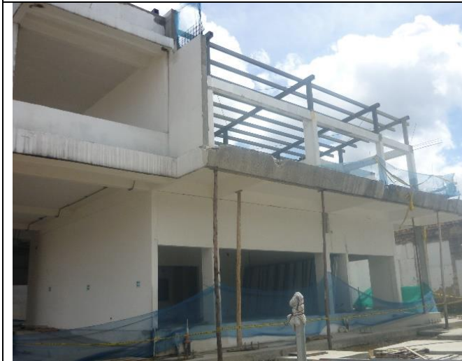
Vista frontal del edificio en proceso de construcción, sin protección a la intemperie.