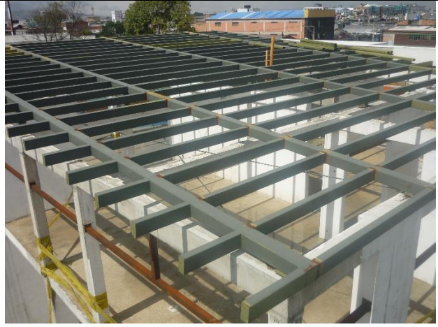
Estructura metálica del techo y segundo piso del edificio expuesto a la intemperie sin ninguna protección.