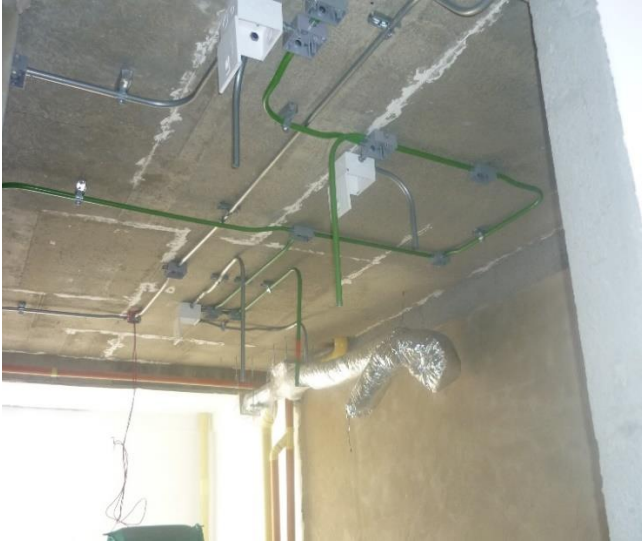
Instalación de varios equipos y/o (facilities), en proceso de instalación de tuberías.