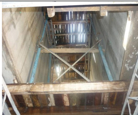
Formaleta para fundir la placa del techo de las escaleras y el socalo del ascensor, esta es la fuente por donde se infiltran las aguas lluvias al edificio Data Center, poso del ascensor y primer piso.