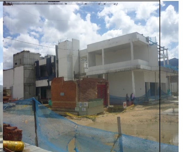
Vista frontal y lateral del edificio sin protección a la intemperie.