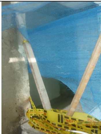
Fondo socalo ascensor lleno de agua por falta del techo o cubrimiento del mismo.