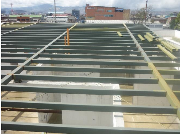
Estructura metálica del techo y segundo piso del edificio expuesto a la intemperie sin ninguna protección.