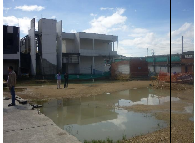
Materiales expuestos a la intemperie sin ninguna protección a un costado del edificio.