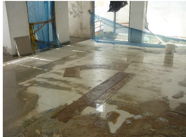
Primer piso del edificio con afectación permanente de humedad por el ingreso de aguas lluvias.