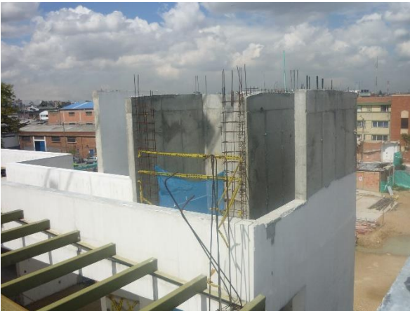
Zona de escaleras y sócalo del ascensor, sin placa del techo y sin ninguna protección para evitar el ingreso de aguas lluvias.