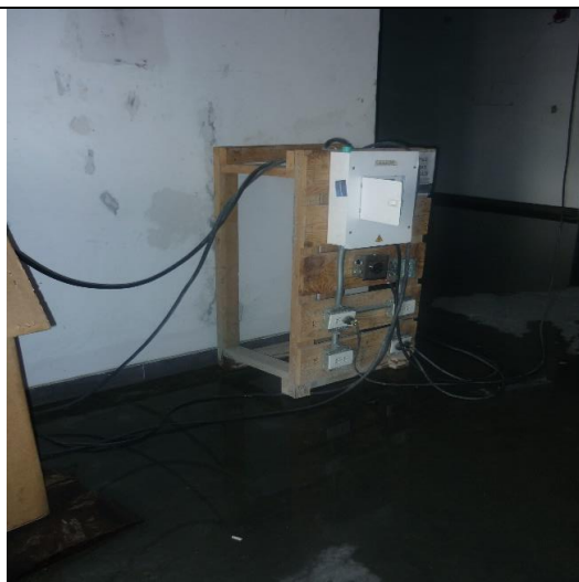
Instalación eléctrica provisional con el piso saturado de agua.